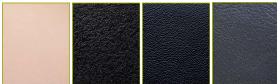
Bio-palmilha de cor rosa bebé